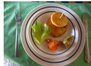
Käserei mit Überraschung

Die 42 Tage Türkei – Griechenland Tour, genannt „Götterberg Tour“, führt Sie zum „Götterberg“.