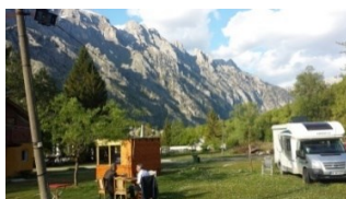
Camp in Valbona