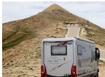
Das Ziel unserer Tour: der „Nemrut Dag“ bei Damlacik