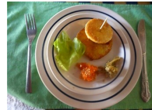
Käseerei mit Überraschung

Die 42 Tage Türkei – Griechenland Tour, genannt „Götterberg Tour“, führt Sie zum „Götterberg“. Unsere Reiseleiter Peter und Monika sind Türkei Spezialisten haben die Tour im Mai 2016 nochmals für Sie abgefahren und wunderschöne Camps für Sie ausgesucht. Kommen Sie mit uns mit und wenn Sie diese Tour bis zum Beginn der CMT in Stuttgart am 14.01.2017 buchen, erhalten Sie