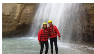
Rafting Tour in der Osoumi Schlucht