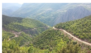
Jeep Tour in die Berge zu einer Käseerei