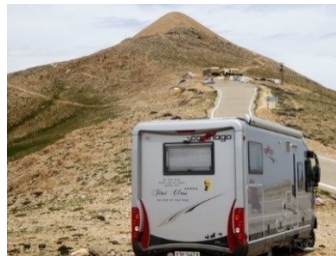
Das Ziel unserer Tour: der „Nemrut Dag“ bei Damlacik