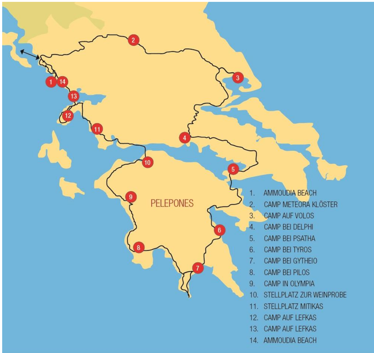
Unsere Tour in Griechenland

(mit Anschluss Tour Albanien kombinierbar)