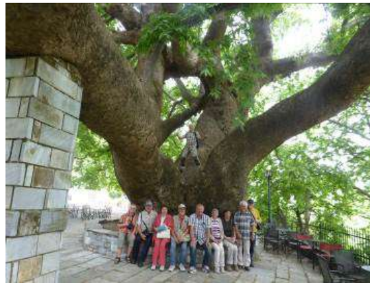
Wir besuchen die 1000-jährige Platane in Tsangarade

fahren mit der historischen Schmalspurbahn auf dem Pilion und umrunden es auf wilden Straßen während eines Busausfluges , speisen fürstlich griechisch und lauschen den Klängen der typischen Musik.