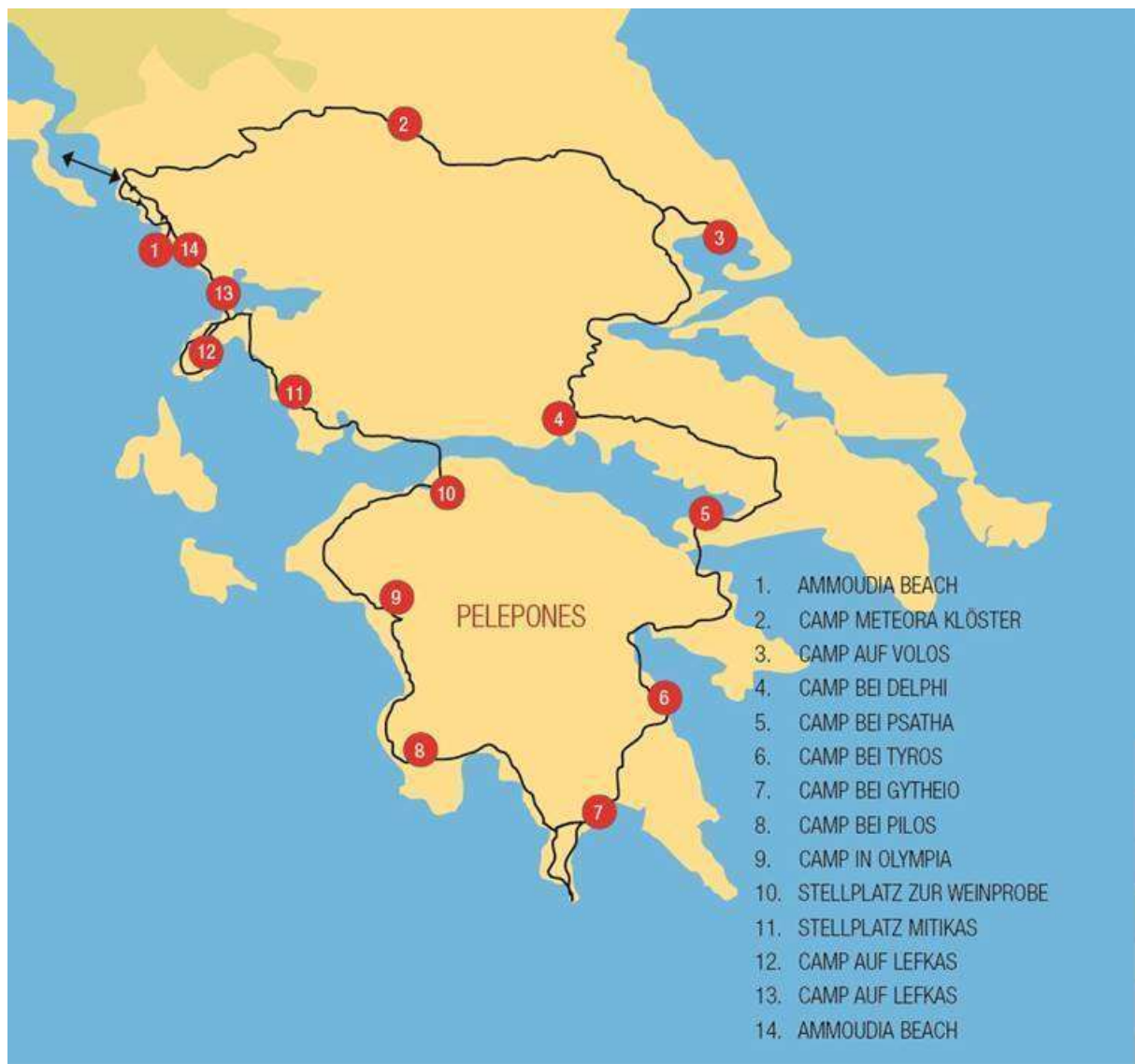
Unsere Tour in Griechenland

Die Reisen mit Dr. Ammon-Tours sind für jene Reisefreunde gedacht, die es lieben, andere Kulturen und deren Menschen hautnah kennen zu lernen, sich an Landschaften erfreuen und bereit sind, ausgetretene Touristenpfade zu verlassen und selbständig neue zu erkunden. Unsere Griechenland Tour bietet Ihnen interessante Einblicke in die reichhaltigen griechischen Landschaften und das Leben der Menschen . Herausragende kulturelle Sehenswürdigkeiten runden unsere einmalige Rundfahrt ab. Unsere Griechenland Tour ist keine Städte Tour. Es ist eine ausgewogene Mischung aus Landschaften, Leben, Kultur und Gaumenfreuden!