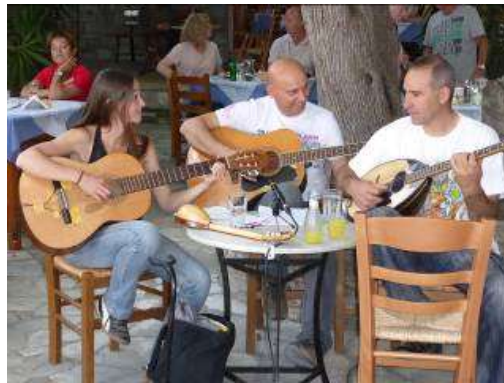
Griechische Musikanten sorgen für Stimmung

Unsere Bildergalerie über unsere Griechenland Tour: